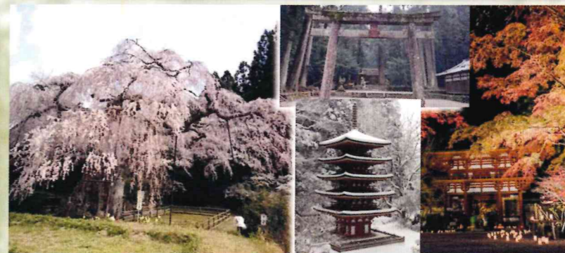
室生地区まちづくり協議会