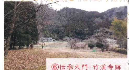
⑥伝承大門・竹溪寺跡