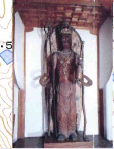
⑩高堂の十一面観音菩薩